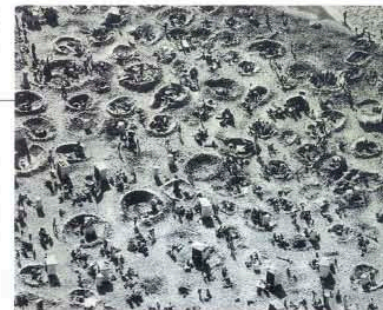
Ritueel landschap met kuilen in het Noordzeestrand.

Een begrafenis is veelal het einde van een hectische periode met emoties, geregel en het delen van herinneringen. Na de begrafenis is er ruimte voor opluchting. Op begraafplaatsen gebruiken we water als spiegel van de lucht. We willen de wolken langs de lucht zien jagen met de wind door de haren. We willen een zichtbare horizon, als metafoor van het oneindige leven. We willen de wind door de bomen en het riet horen ruisen.