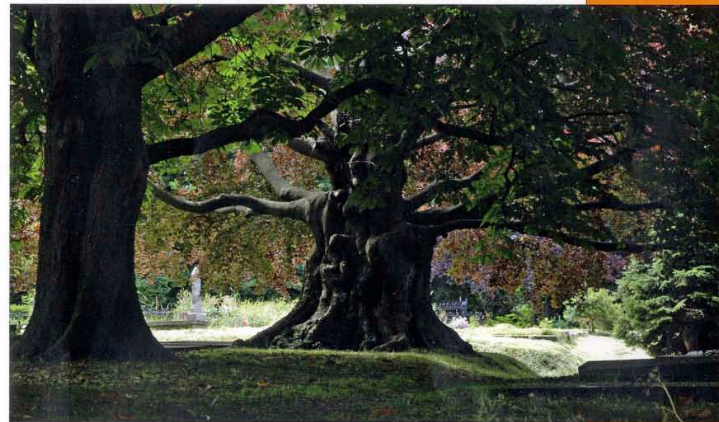
Ruimte voor bruine-beuken op begraafplaats De Groene Steeg in Leiden.

Voor Copijn Tuin- en Landschapsarchitecten is het belangrijk nabestaanden ruimte te geven voor het ritueel van begraven. We bieden houvast met een heldere routing, brede paden en perspectief. We geven ruimte met de zichtbare horizon en de lucht die met de weersomstandigheden mee verandert. Door verbeeldingskracht raken we het wezen aan van een begraafplaats. Met ontwerpen geven we vorm aan het ritueel van begraven.