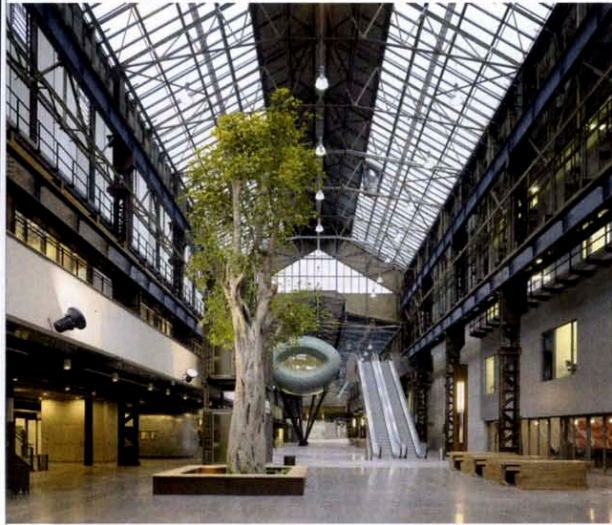
Beeld ROC van Twente. Ontwerp: IAA Architecten.