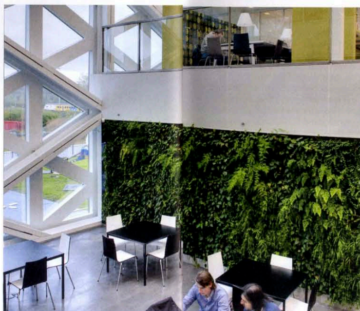
Beeld Studieplekken.