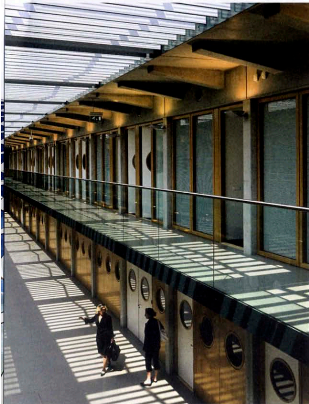
Beeld FPC de Oostvaarderskliniek, Almere. Ontwerp: Studio M10.

leerde de opdrachtgever hoeveel belang hij hecht aan een hoogwaardige gevelafwerking. Ook het bureau van Vos heeft de directievoering kunnen doen en de inrichting. En door omstandigheden, waaronder het maken van het masterplan, heeft tussen ontwerp en bouwen van de school meer tijd gezeten dan gedacht. Daardoor ontstond de mogelijkheid om interieur en exterieur 'helemaal uit te ontwerpen' en uitgebreid met gebruikers te overleggen over de door hun gewenste plek in het gebouw. Vos: 'De opdrachtgever had vanaf het begin consequent voorkeur voor het ontwerpmodel met het grote atrium. De school is van binnen en van buiten zo mooi geworden, omdat we vervolgens zoveel aandacht konden besteden aan uitwerking en verhoudingen.'