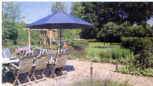
Voor elk wat wils: speeltoestellen, een zonneterras en plantenborders.

Wil je juist wel lekker veel planten, zorg dan dat er elk seizoen wat te beleven valt, zegt Frederike. „Laat je niet verleiden tot wat je nu in het tuincentrum in bloei ziet staan, want dan heb je in de herfst en winter niks. Wel kun je bijvoorbeeld een struik kiezen die in het voorjaar bloeit en in de winter heel mooi gekleurd blad heeft. Mocht je niet te veel onderhoud willen, dan kun je gebruik maken van bodembedekkende planten.”