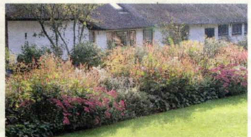
Kleur in alle seizoenen, maakt een tuin het jaar rond interessant.