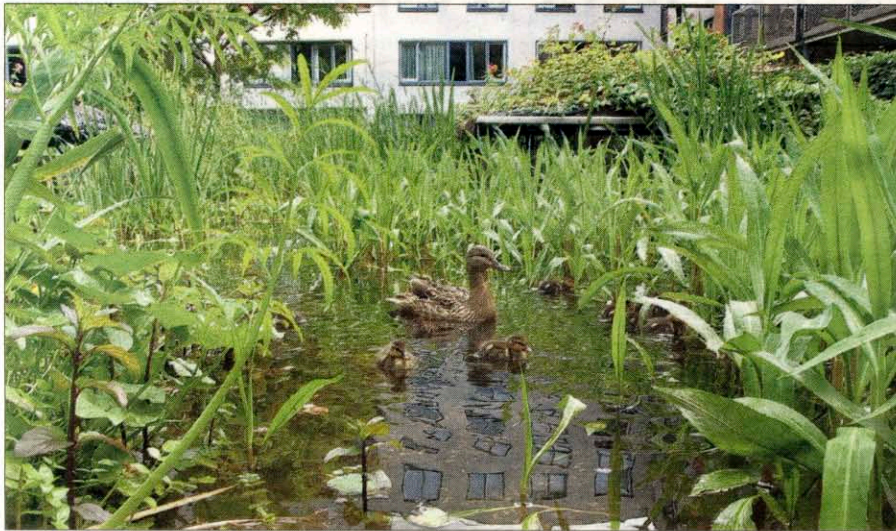
Een waterpartij doet het altijd leuk in een tuin.

Ze adviseert mensen die een tuin gaan inrichten, om eerst de tijd te nemen voor ze met tegels, schuttingen en bakken vol planten aan de slag gaan. „Je kunt natuurlijk direct beginnen, maar het is een goed idee om eerst eens te kijken en te ervaren wat voor tuin je hebt. Wat zijn de zonnige plekken, waar zou je zelf willen zitten en hoe ziet de omgeving eruit. Misschien staat er in de verte wel een mooi kerkje, of staat er een mooie grote boom in de buurt. Je kunt dit soort elementen benadrukken en bij je tuin betrekken door een zichtlijn te maken naar zo'n kerktoren of boom. Dat kan bijvoorbeeld met behulp van een paadje. Of markeer de lijn met