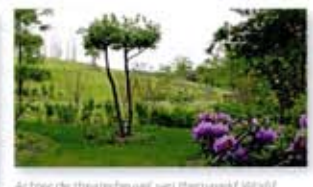
Achter de theaterheuvel van themaveld World Show Stage ligt de Heestervallei. Hier zijn, naast vele heesters, een bijzondere bomen tegen de bosrand geplant.