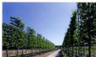
De dubbele rijen leilindes begeleiden de doorgang van de mathematisch getoekte heuvel.