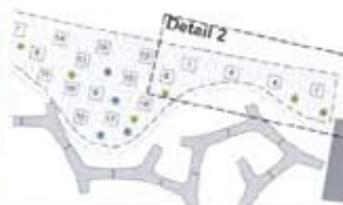
De plek waar op potten met planten komen zijn geïmporteerd. De grijze grillige vormen zijn zitbanken.