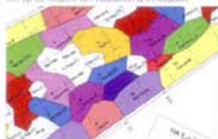
Bepalingsgebieden Floriade 2012 (vrijwel alle namen).