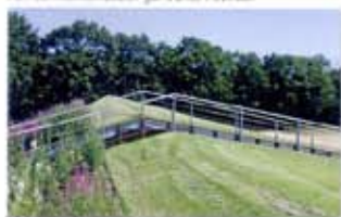
Tegen de smalle heuvels van Education & Innovation staan de centrale vaste planten.