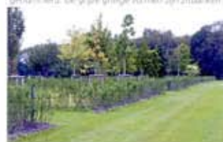
Op de zonnige allee van het themaveld Environment begeven bezoekers de bomen.