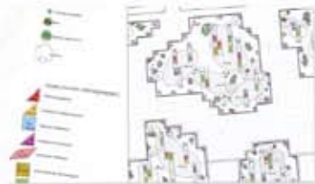
Beplantingsplan themaveld Green Engine en legenda.