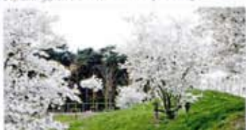
Bloeiende prunussen op themaveld Relax & Heal.