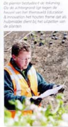
De planter bezuigt de rekening. De de achtste grond ligt tegen de heuvel van het themaveld Education & Innovation. Het houten frame dat als hulpmiddel dient bij het uitzetten van de planten.

De wereldtuinbouwexpo Floriade wordt eens in de tien jaar georganiseerd, per traditie in de Randstad, maar in 2012 voor het eerst daarbuiten: in Venlo. De tentoonstelling opent op 5 april 2012 haar poorten en loopt dan nog tot met oktober van dat jaar. In drie opeenvolgende nummers van Groen (augustus, september en oktober 2010) besteden we aandacht aan dit evenement. In dit nummer het tweede deel van dit drieluik, over de beplanting.