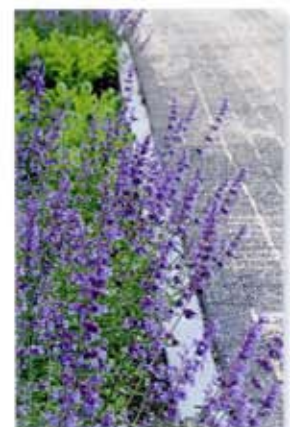
Stad en begroeiing komen dicht bij elkaar in themaveld Environment .