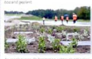
De regels tussen de beplanting achter de zitbanken van World Show Stage dienen voor de lege te plaatsen zonnen.