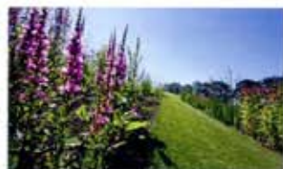
Tweemaalveel aandacht na het planten bloeien: de planten op de heuvels van Education & Innovation .