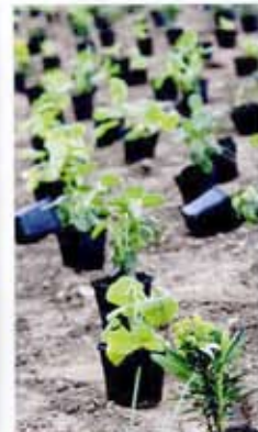
De planten staan op de juiste plek. In wachten tot ze geplant worden.