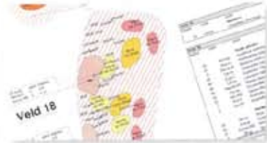
Beplantingsplan themaveld Relax & Heal.